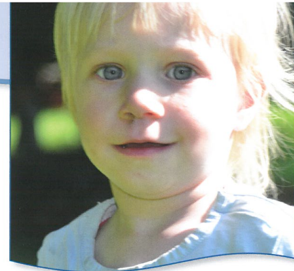
Neu Wulmstorf - eine attraktive Gemeinde für Jung und Alt

Neben zahlreichen Einkaufsmöglichkeiten und einer guten Ärzteversorgung bietet Neu Wulmstorf außerdem viele Vereine und Vereinigungen aus den Bereichen Sport, Kultur, Kunst, Religion, Politik und Soziales, die das gesellschaftliche Leben im Ort prägen. Die Gemeindebücherei,