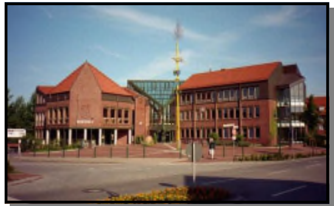
Rathaus der Gemeinde Neu Wulmstorf

Telefon: (0 40) 700 78-0 Fax: (0 40) 700 78-189 E-Mail: gemeinde@rh-neu-wulmstorf.de