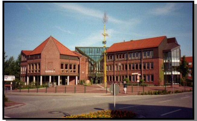
Rathaus der Gemeinde Neu Wulmstorf

Telefon: (0 40) 700 78-0 Fax: (0 40) 700 78-189 E-Mail: gemeinde@rh-neu-wulmstorf.de