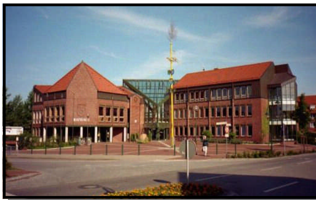
Rathaus der Gemeinde Neu Wulmstorf

Telefon: (0 40) 700 78-0 Fax: (0 40) 700 78-189 E-Mail: gemeinde@rh-neu-wulmstorf.de